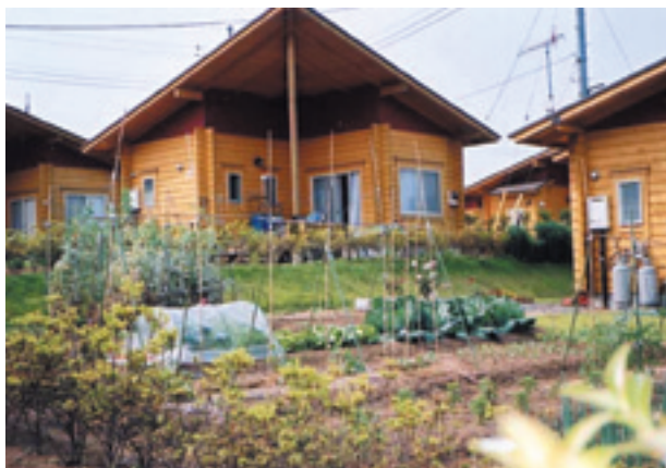
笠間クラインガルテン