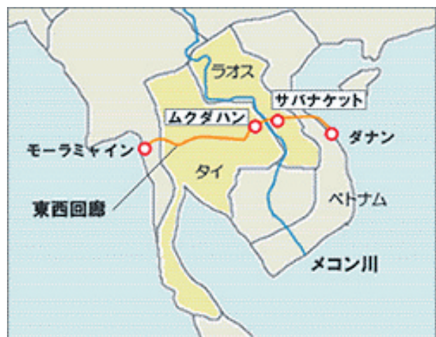
図表4：東西経済回廊

2006年12月には、有償資金協力により、ラオス（サバナケット）ータイ（ムクダハン）国境を結ぶ第2メコン国際橋が完成し、東西経済回廊の全長の約9割にあたるベトナム（ダナン）・タイ（メーソート）間が開通した 9 。当橋の開通によって、特にベトナム（ダナン）・ラオス（サバナケット）・タイ（ムクダハン）間の物流・人の往来が容易となるこ