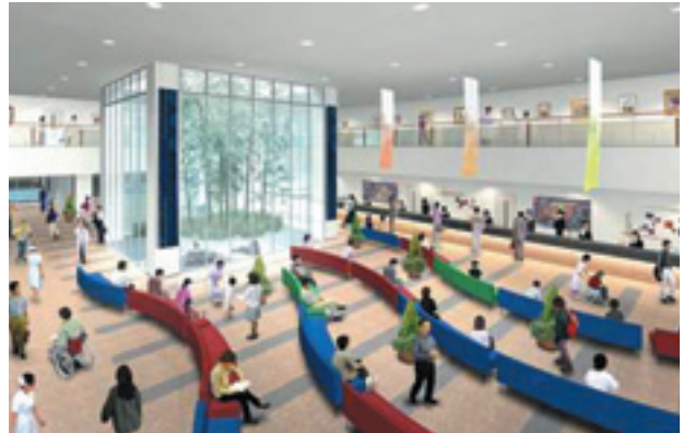
新病院の受付イメージ図

現在、自治体病院の約9割は赤字と言われているが、自治体病院には地域医療を支える立場から、